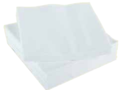
witte servetten of keukenrol